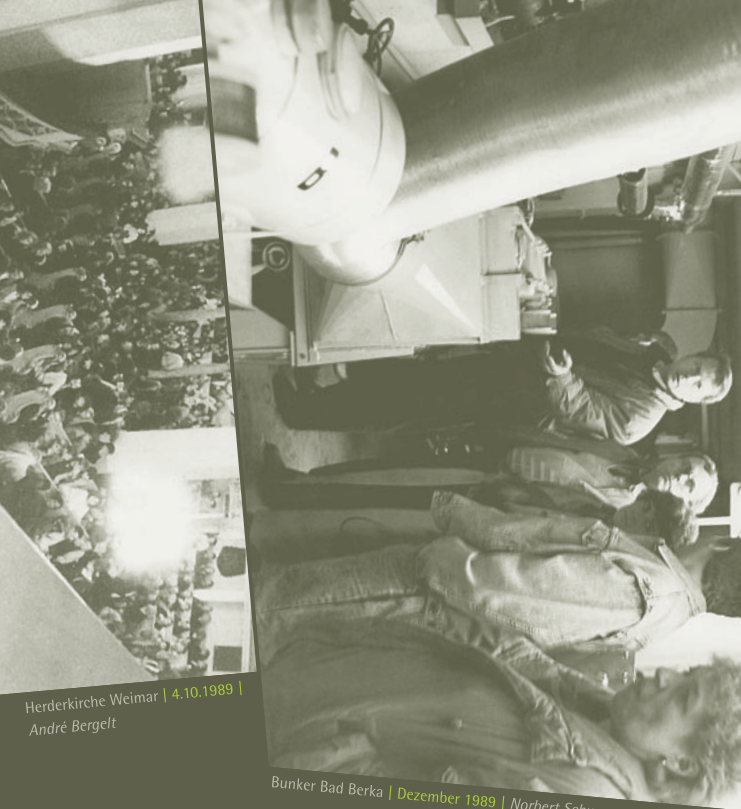
Herderkirche Weimar | 4.10.1989