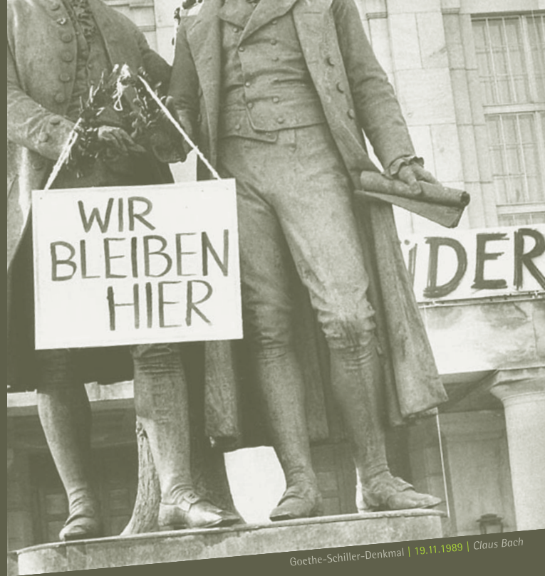
Goethe-Schiller-Denkmal | 19.11.1989